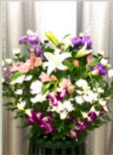
枕花 1対 16,500円