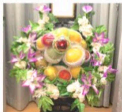
籠盛 1基 10,800円