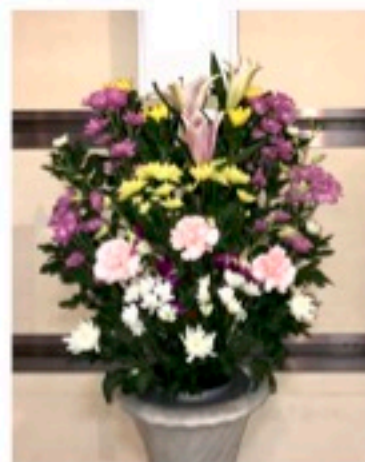
生花 1対 13,200円