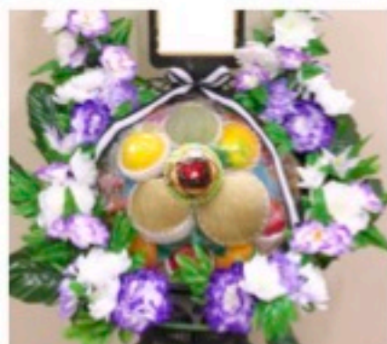
籠盛 1基 12,960円

*果物盛は昔ながらの果物各種の盛合せです 缶詰盛は暑い季節やお持ち帰りの際に便利です