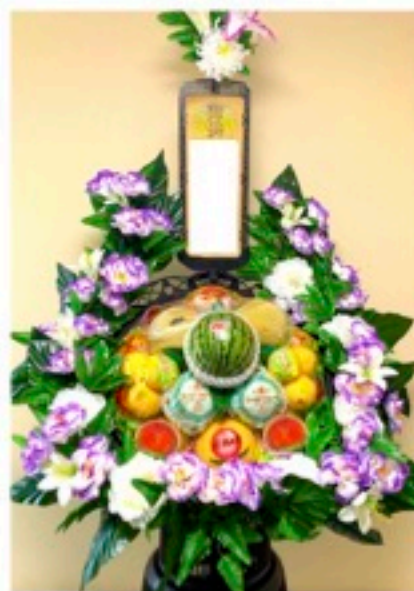
籠盛(果物) 1基 16,200円