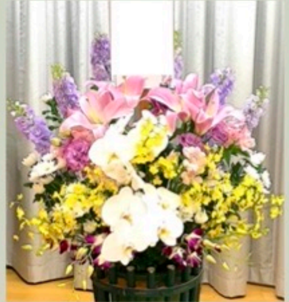
枕花 1対 33,000円