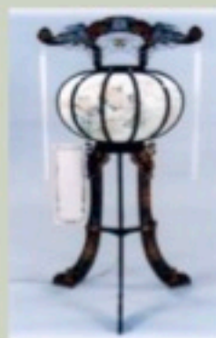
回転提灯 1対 八坂 13,200円