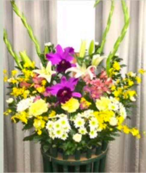
枕花 1対 22,000円