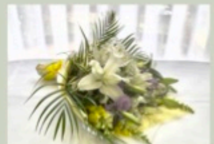
棺上花束 11,000円 22,000円 33,000円 *写真は22,000円

株式会社 公益社 関市西本郷通3-2-9 TEL 0575-22-3254 FAX 0575-22-3280