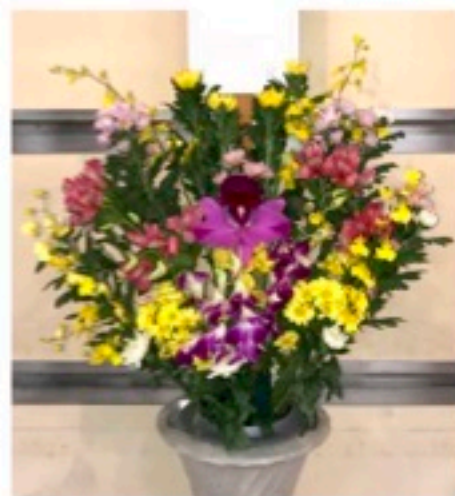
生花 1対 16,500円