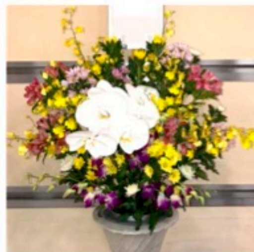
生花 1対 22,000円