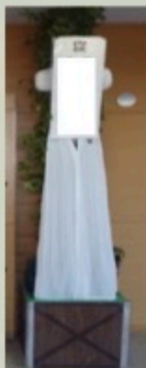
檜塔 1対 22,000円 榊塔 1対 25,300円