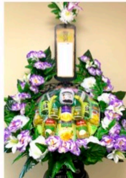
籠盛(缶詰) 1基 16,200円